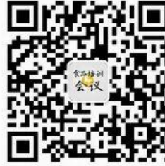
食品会议培训中心