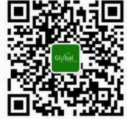
食品伙伴网国际站