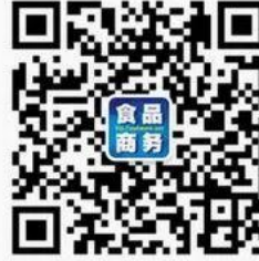
食品伙伴网商务中心