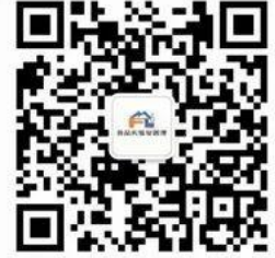
实验室管理与服务