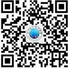
水产加工技术联盟