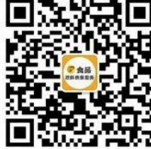
食品原料供需服务