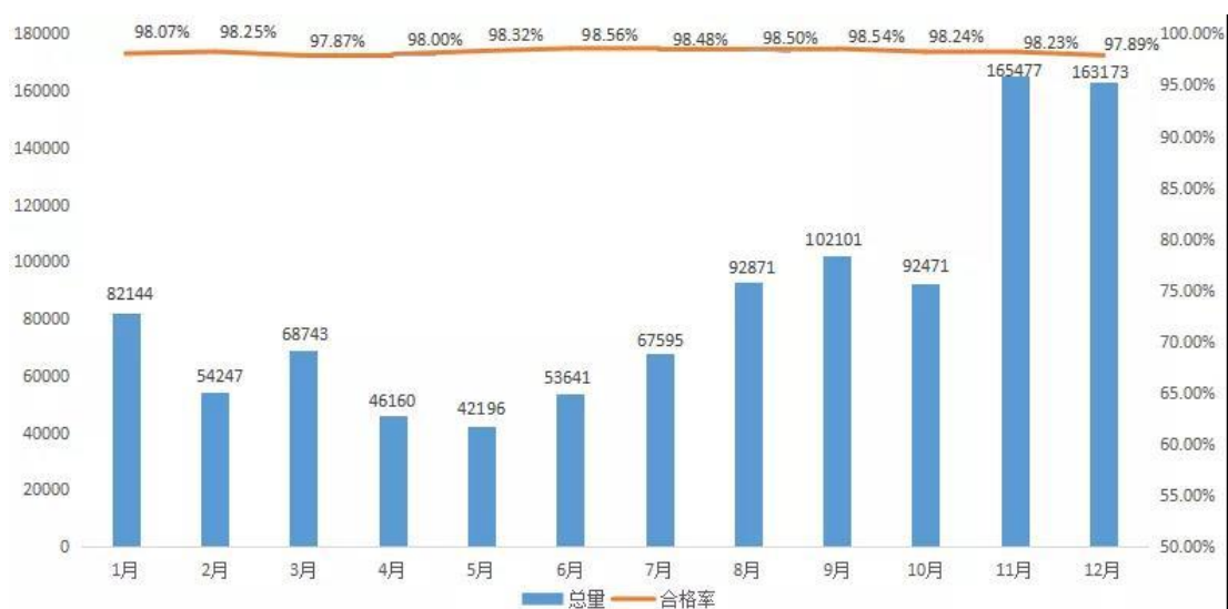
图 1 2021 年各月份抽检情况统计

从月度抽检量看，11、12月份抽检量较大，判断与元旦春节期间监管部门加大抽检量有关；从月度抽检合格率看，各月合格率变化平稳，没有较大波动。2021年各月份抽检量及合格率详见图1。