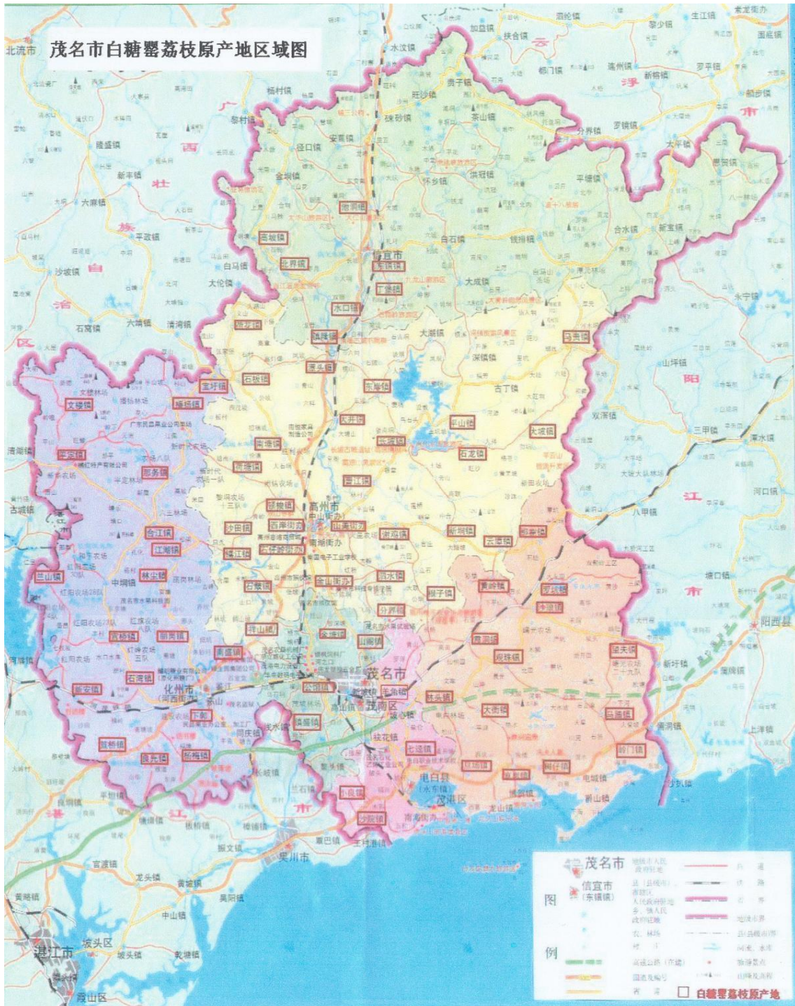
茂名白糖罂荔枝地理标志产品保护范围（旧行政区域）