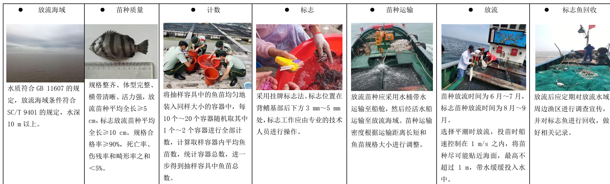
图C.1 条石鲷增殖放流技术模式图