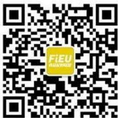
食品原料供需服务