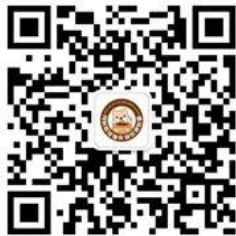
饲料和宠物食品合规