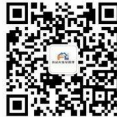
实验室管理与服务