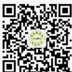
食品饮料创新研究