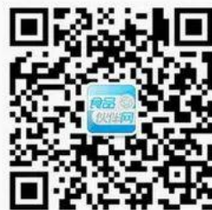
食品伙伴网订阅号