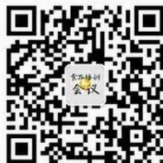
食品会议培训中心