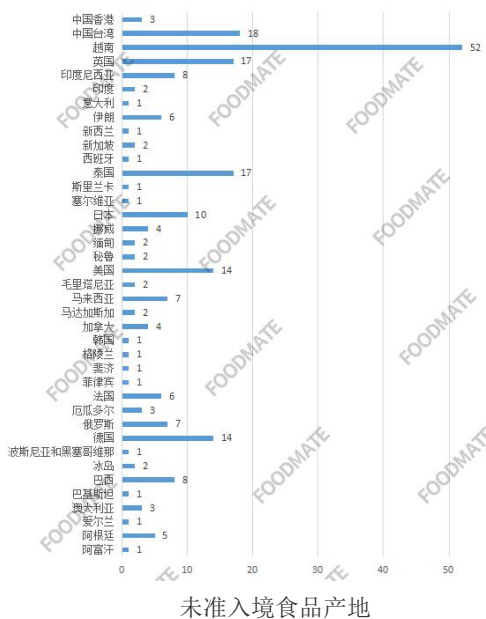
未准入境食品产地

信息显示，未准入境的食品产地有阿富汗、阿根廷、爱尔兰、澳大利亚、巴基斯坦、巴西、冰岛、波斯尼亚和黑塞哥维那、德国、俄罗斯、厄瓜多尔、法国、菲律宾、斐济、格陵兰、韩国、加拿大、马达加斯加、马来西亚、毛里塔尼亚、美国、秘鲁、缅甸、挪威、日本、塞尔维亚、斯里兰卡、泰国等。其中，来自越南的未准入境食品数量最多，有52批次，涉及果汁、干仿刺海参、腰果仁、虾仁等。