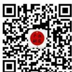
食品饮料产业研究