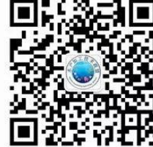
水产加工技术联盟