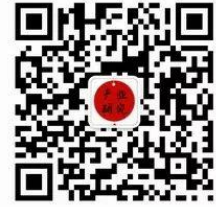
食品饮料产业研究