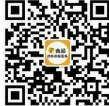
食品原料供需服务