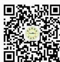
食品饮料创新研究