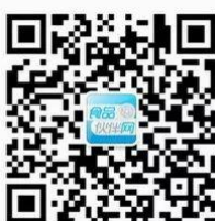
食品伙伴网订阅号