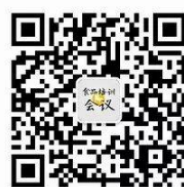
食品会议培训中心