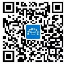
特殊食品与添加剂