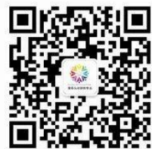
营养与功能性食品