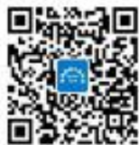
特殊食品与添加剂