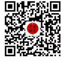
食品饮料产业研究