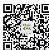
食品会议培训中心