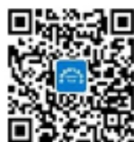
特殊食品与添加剂