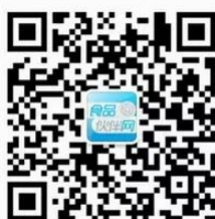
食品伙伴网订阅号