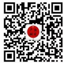
食品饮料产业研究