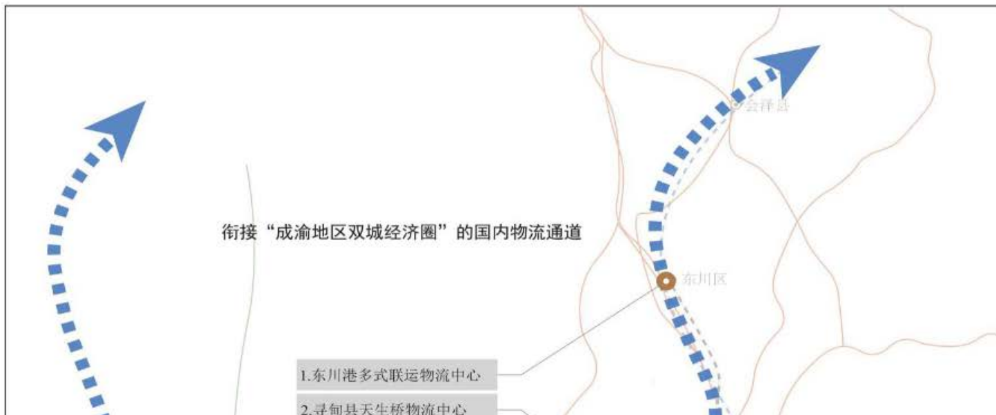
昆明市“十四五”现代物流业空间布局图