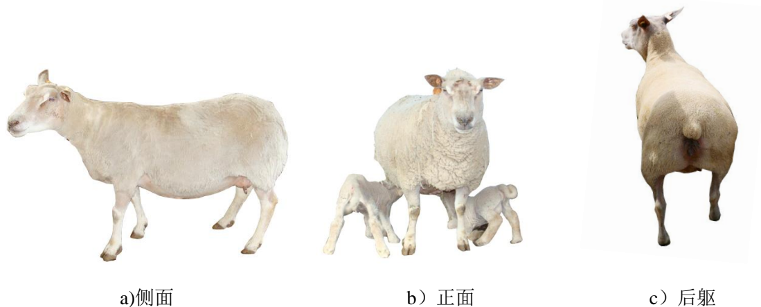
图 A.2 夏洛莱羊种母羊